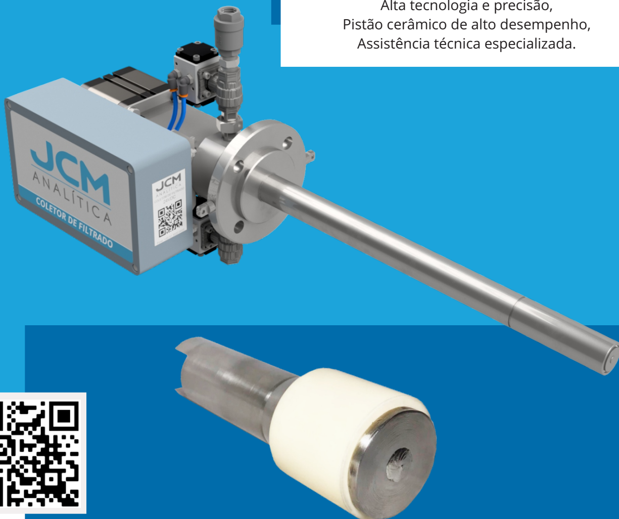
Pistão Cerâmico JCM

Melhor performance do coletor, Agilidade na reposição de materiais, Alta tecnologia e precisão, Pistão cerâmico de alto desempenho, Assistência técnica especializada.